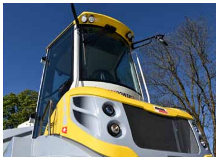
180° otáčivá kabina s prostorným, ergonomicky řešeným kokpitem